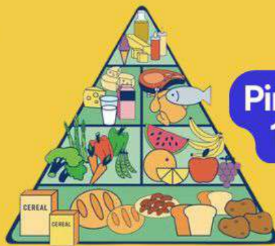
Pirámide de 1992 1992 Pyramid

Menos foco en "calorías", más en calidad. Less focus on "calories," more on quality.